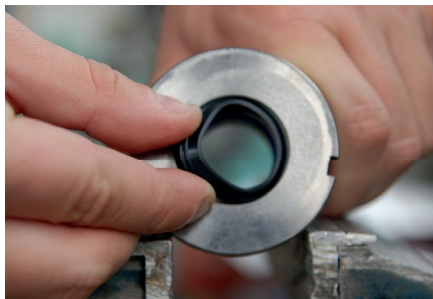
An einer Stelle in die Nut setzen.