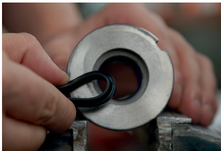
Abstreifer oval verformen.