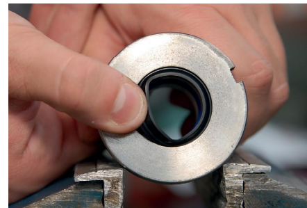
Nachdrücken bis der Abstreifer einschnappt.